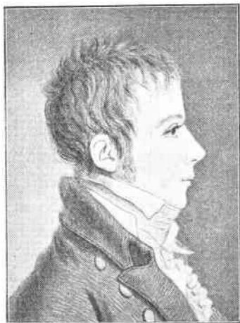
Hans Christian Ørsted som ung.