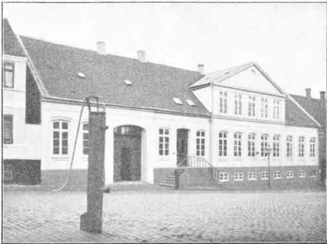
H. C. Ørsteds Barndomshjem i Rudkjøbing.

En god Del Bibelkundskab fik de to Brødre hos Oldenburgs , og som Bevis for, at Hans Christian ikke