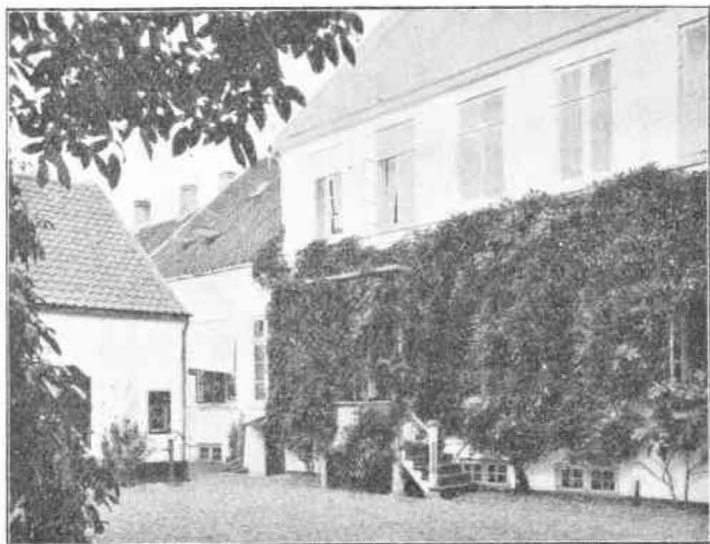
Gaardparti fra H. C. Ørsteds Barndomshjem.

antog Faderen dem som Medhjælpere i Apoteket. Anders Sandøe havde ingen Lyst til Arbejdet her, og det varede ikke længe, før han med Faderens stiltiende Samtykke forsvandt derfra. Hans Christian , der ligesom Anders Sandøe hidtil havde villet være Præst, fik Smag for kemiske Arbejder og fordybede sig i Naturvidenskaberne, og fra nu af var han vundet for