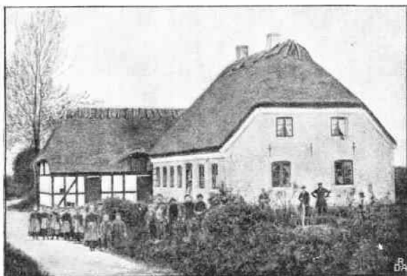
Rudme friskole 1860.

Friheden tro i krig og fred, sandheden tro i kærlighed, livet tro i alle dele det er kærnen i det hele.