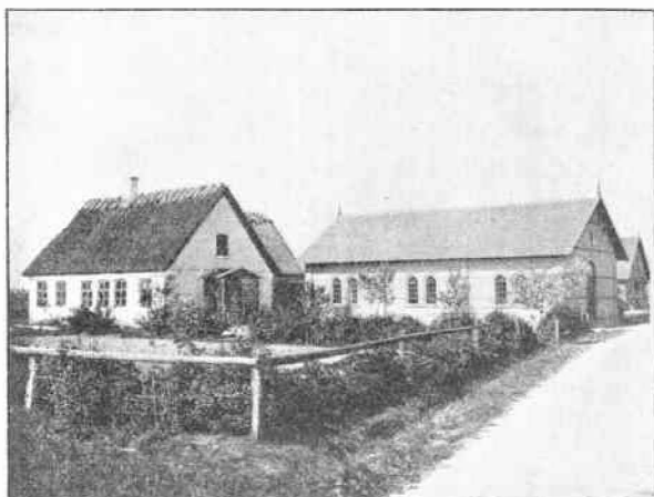
Friskolen af 1877 og 1885.