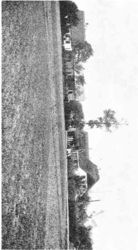
Rindne friskole 1910.